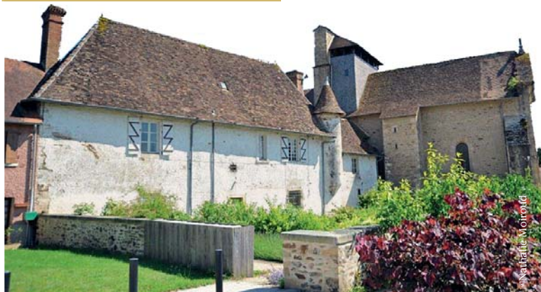
> Le Presbytère de Vicq-sur-Breuilh

2013, OUVERTURE DES MUSÉE ET JARDINS CÉCILE SABOURDY