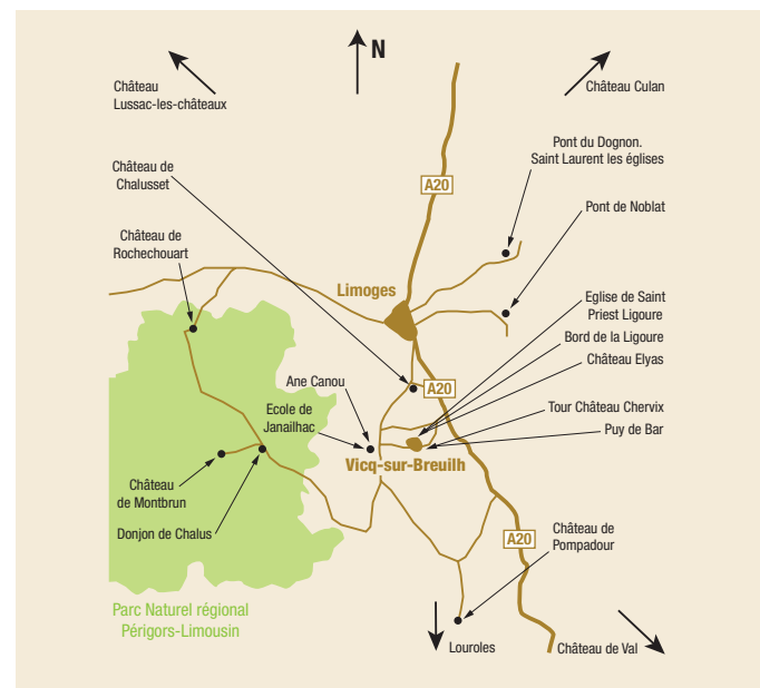
> Lieux peints par Cécile Sabourdy

villageois, moments agraires...) et peignait souvent à partir de cartes postales. Son œuvre, au cœur de la collection permanente du futur Musée, constitue une formidable clé d'entrée sur le territoire limousin à travers la variété des sites représentés (Rochechouart, Pompadour, Chalucet, Janailhac...). Elle offre aussi une magnifique mise en scène de la ruralité passée permettant notamment d'appréhender notre ruralité contemporaine.