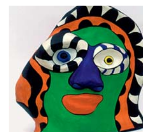
> « Petit témoin visage vert », Niki de Saint-Phalle, 1971 Collection MAMAC Nice