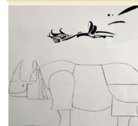
> Affiche de François-Xavier Lalanne (détail)

En créant des mécanismes astucieux, Calder excelle dans l'art d'utiliser le mouvement, fondateur de ses mobiles et ses portraits au fil de fer : « sublimation d'un arbre dans le vent » selon Marcel Duchamp.