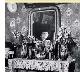
> Cécile Sabourdy photographée chez elle par Brassai ©Estate Brassai - RMN

Connu pour avoir fait de la nature et des animaux le support de leurs créations, ce couple d'artistes inclassables a fait le choix de toujours exposer ensemble avec une idée commune : étonner.