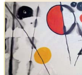
> Gouache de Calder (détail)

« Les Nanas », sculptures aux formes voluptueuses évoquant la femme moderne sont à l'image de cette artiste, mannequin, comédienne, peintre, sculpteur et réalisatrice, engagée dans le mouvement féministe des années soixante.