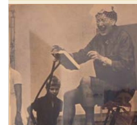
> Affiche de Tinguely (détail)

Acteur majeur du Paris artistique des années vingt, reconnu pour ses clichés du Paris nocturne, Brassai est un artiste pluriel avec ses œuvres autour de la littérature, du dessin et de la sculpture.