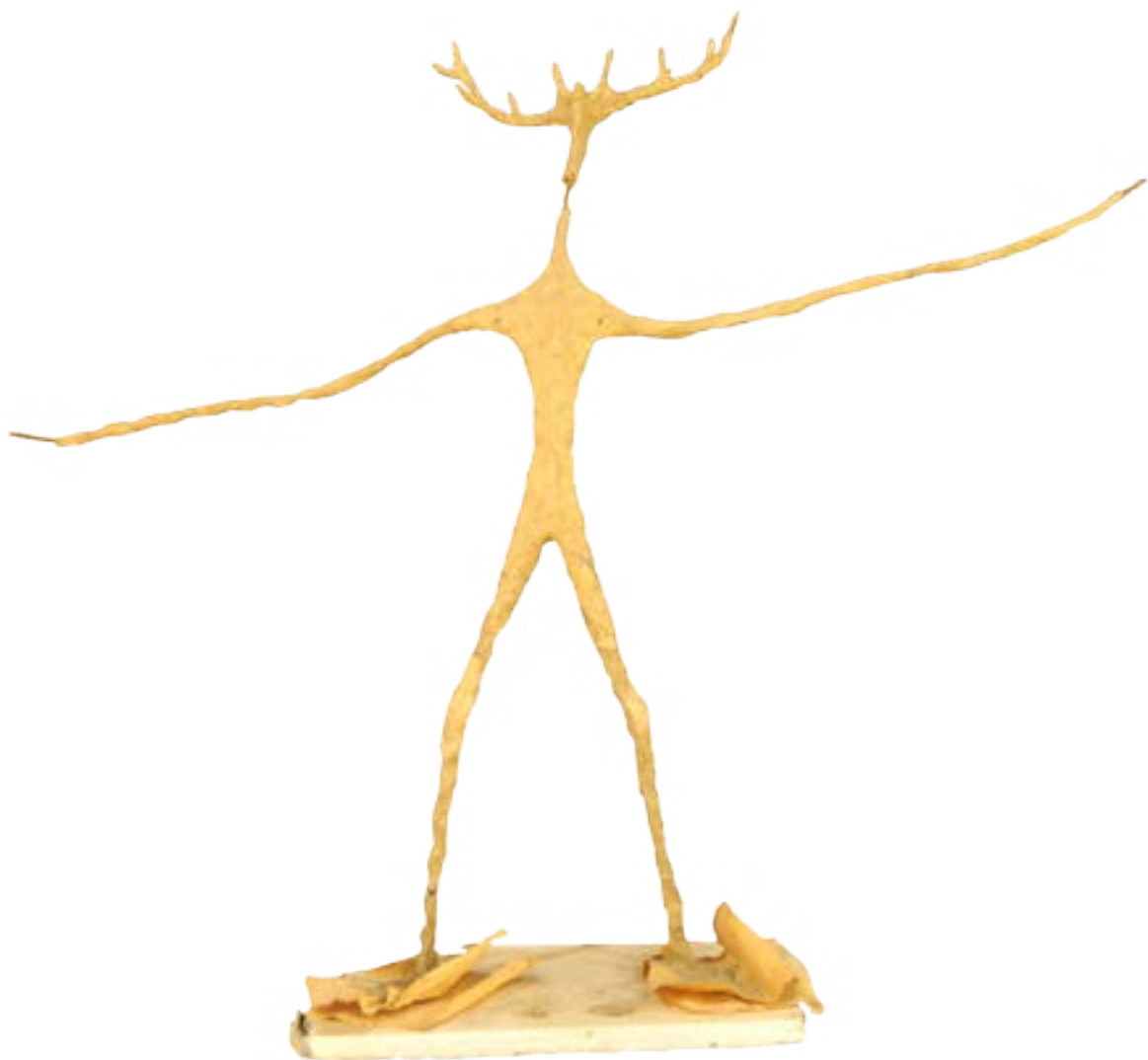
Robert AUPÉTTI, 'sans titre', sculptures non daté, papier mâché, armature métallique COLL. PART