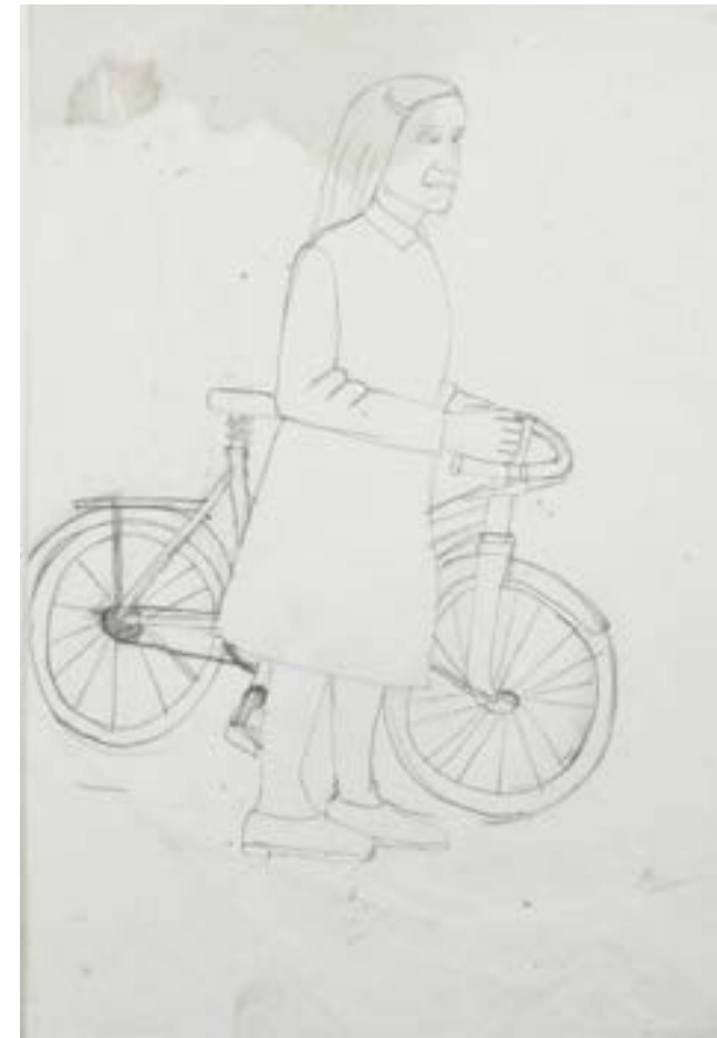
Roger BICHARD, sans titre non daté, crayon à papier COLL. MUSÉE