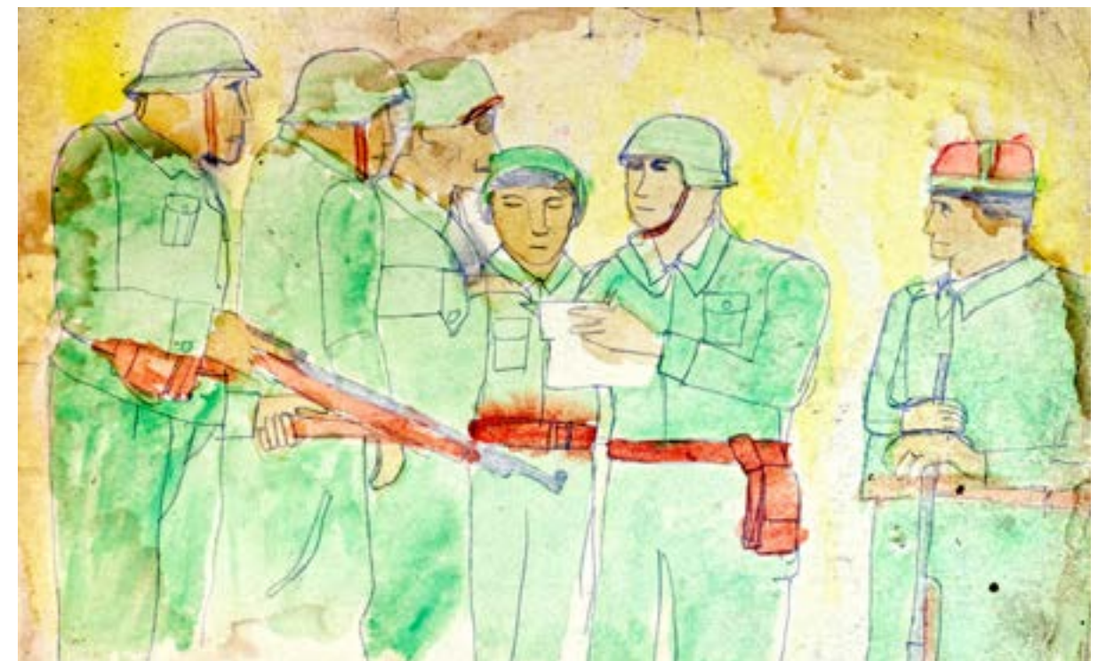
Roger BICHARD, 'les soldats allemands' vers 1953, crayon, gouache COLL. MUSÉE