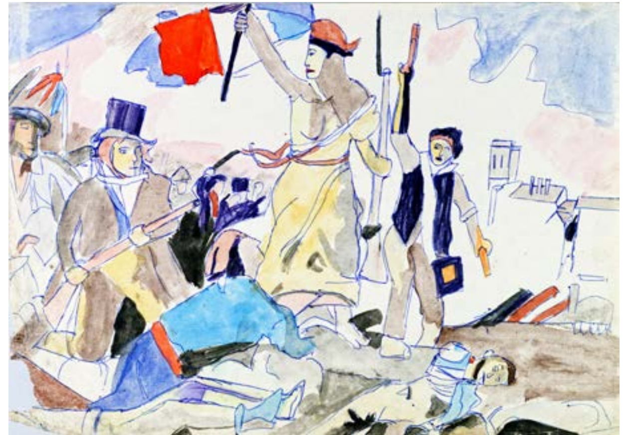
Roger BICHARD, 'la liberté guidant le peuple' non daté, gouache, stylo à bille, feutre d'après Eugène Delacroix, Huile sur toile, 1830, Musée du Louvre, en dépôt au musée de Lens COLL. MUSÉE