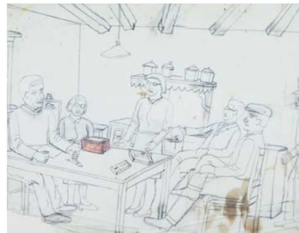
Roger BICHARD ► sans titre non daté, crayon à papier, crayon de couleurs

Les paysages habités et leurs protagonistes sont fixés non sur la pellicule, mais sur la feuille, le soir à la lueur de la bougie. C'est alors que son exceptionnelle mémoire restitue la spontanéité des actes et des lieux avec un sens inné du hors-champ, de la coupe, de l'angle de vue suggestif.