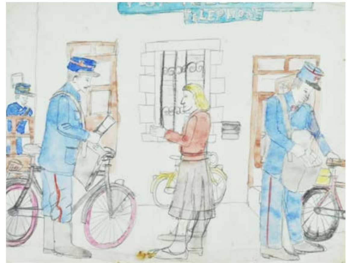
Roger BICHARD, sans titre non daté, crayon à papier, crayon de couleur et gouache COLL. MUSÉE