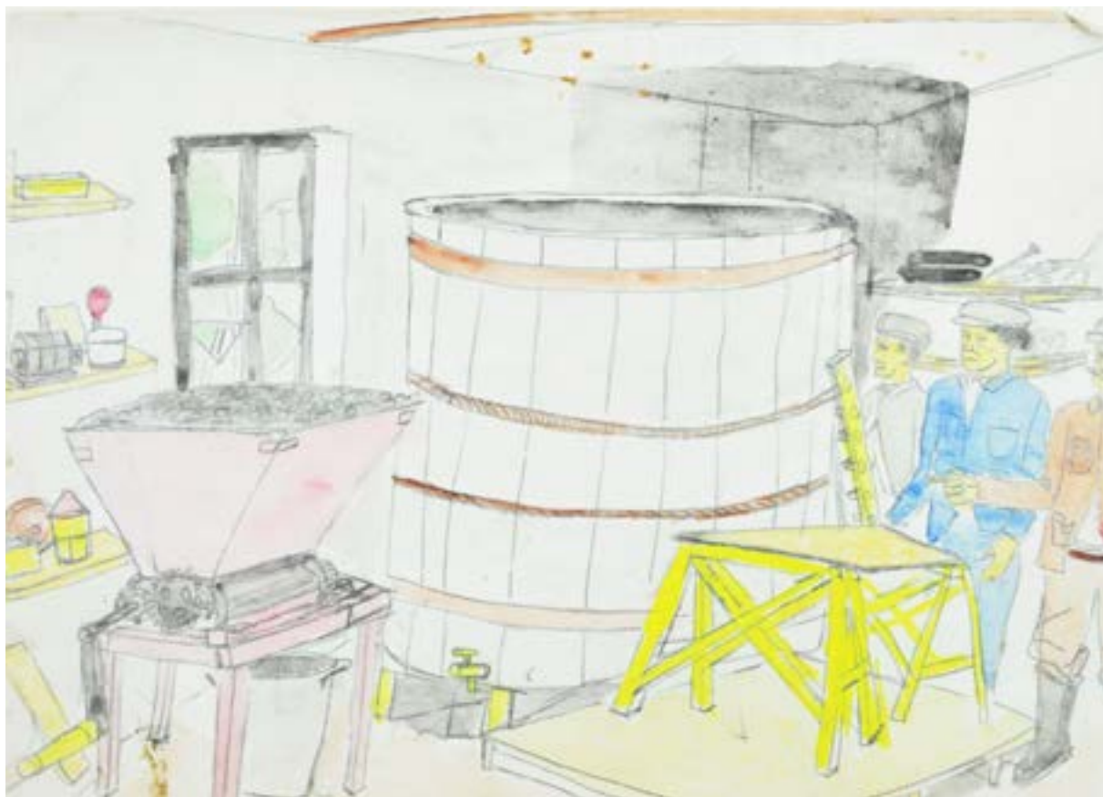
Roger BICHARD, sans titre non daté, crayon à papier, crayon de couleur COLL. MUSÉE