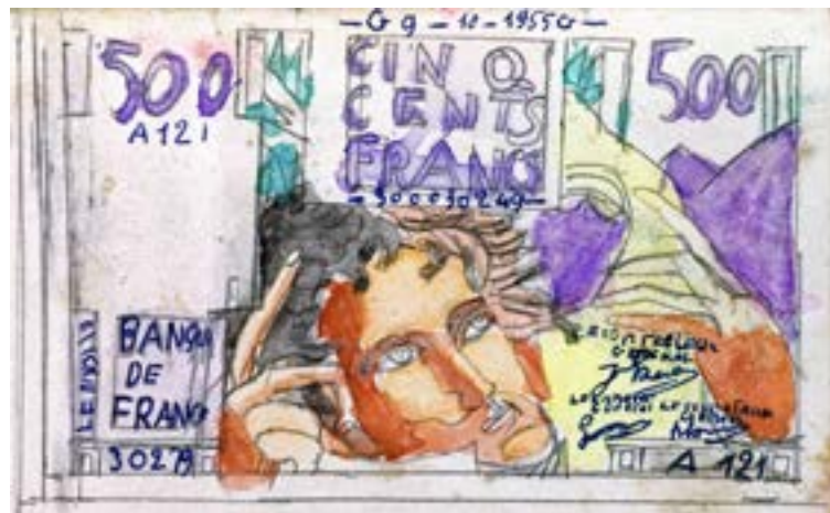
Roger BICHARD, sans titre (billets) non daté, stylo à bille, gouache COLL. PART. DÉPÔT