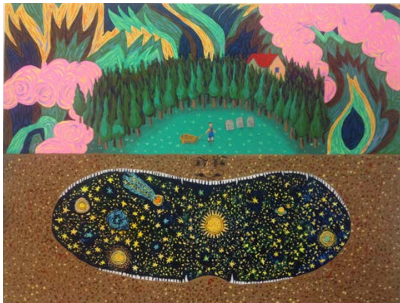
Anne BRÉGEAUT, 'well, well, well' non daté, peinture vinylique sur bois COLL. DE L'ARTISTE