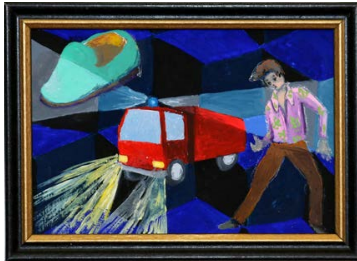
Anne BRÉGEAUT, 'la nuit et puis plus rien' 2015, peinture vinylique sur bois COLL. DE L'ARTISTE