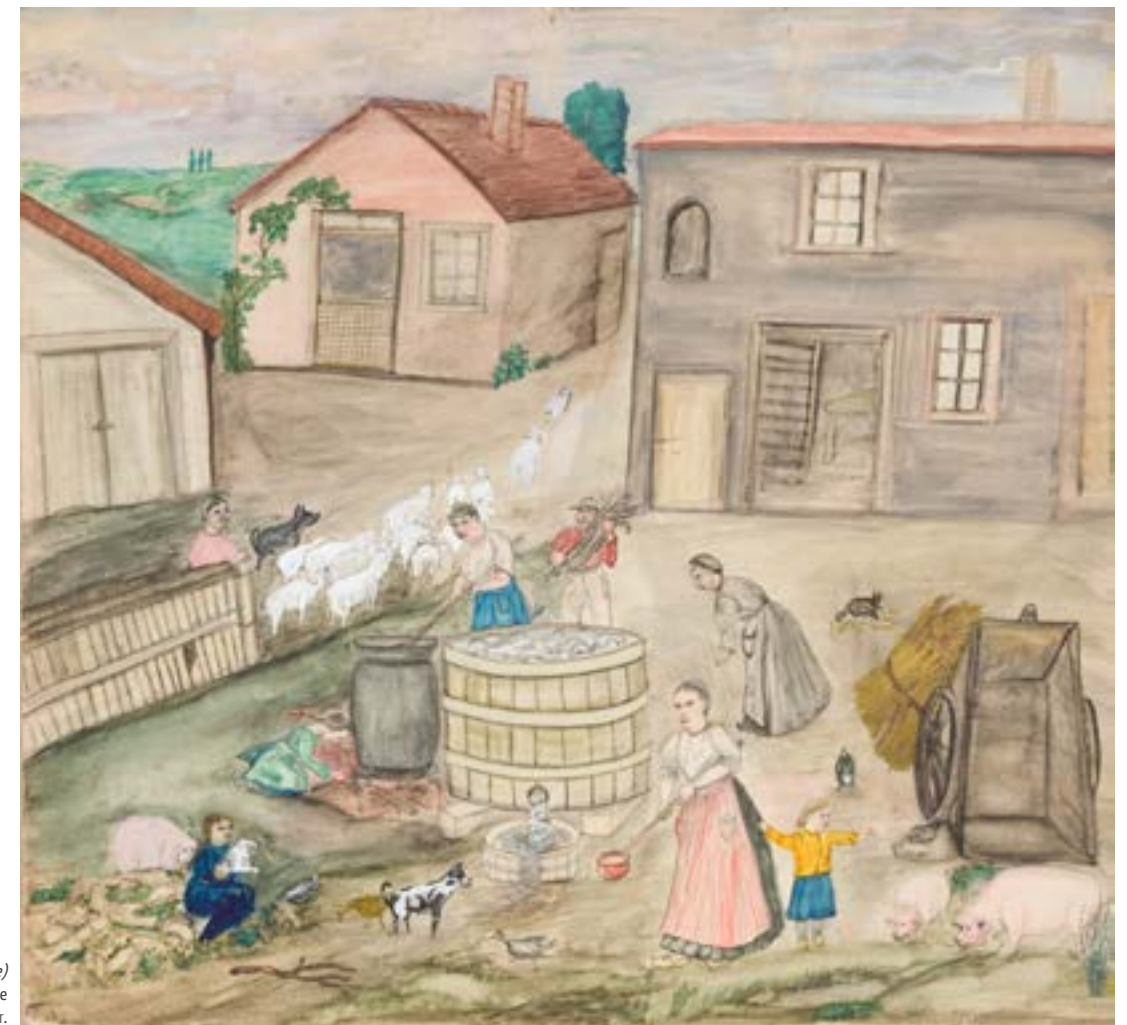
EXISTENCE, sans titre (la lessive) non daté, crayon, aquarelle COLL. PART.