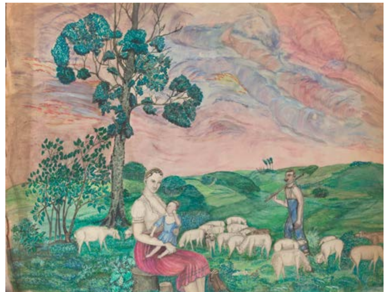
EXISTENCE, sans titre (femme donnant le sein) non daté, crayon, aquarelle COLL. PART.