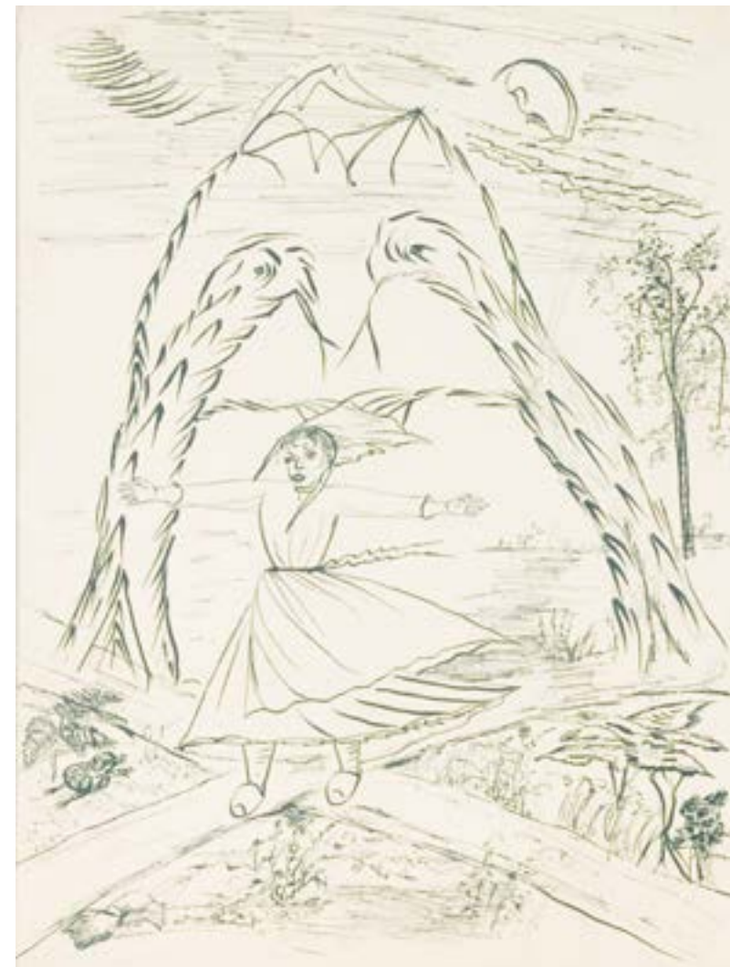
EXISTENCE ▲ sans titre ( deux villageoises ) non daté, dessin à la plume, crayon, gouache ◀ illustration de contes ( jeune fille à la croisée des chemins ), non daté, crayon, encre COLL. PART.