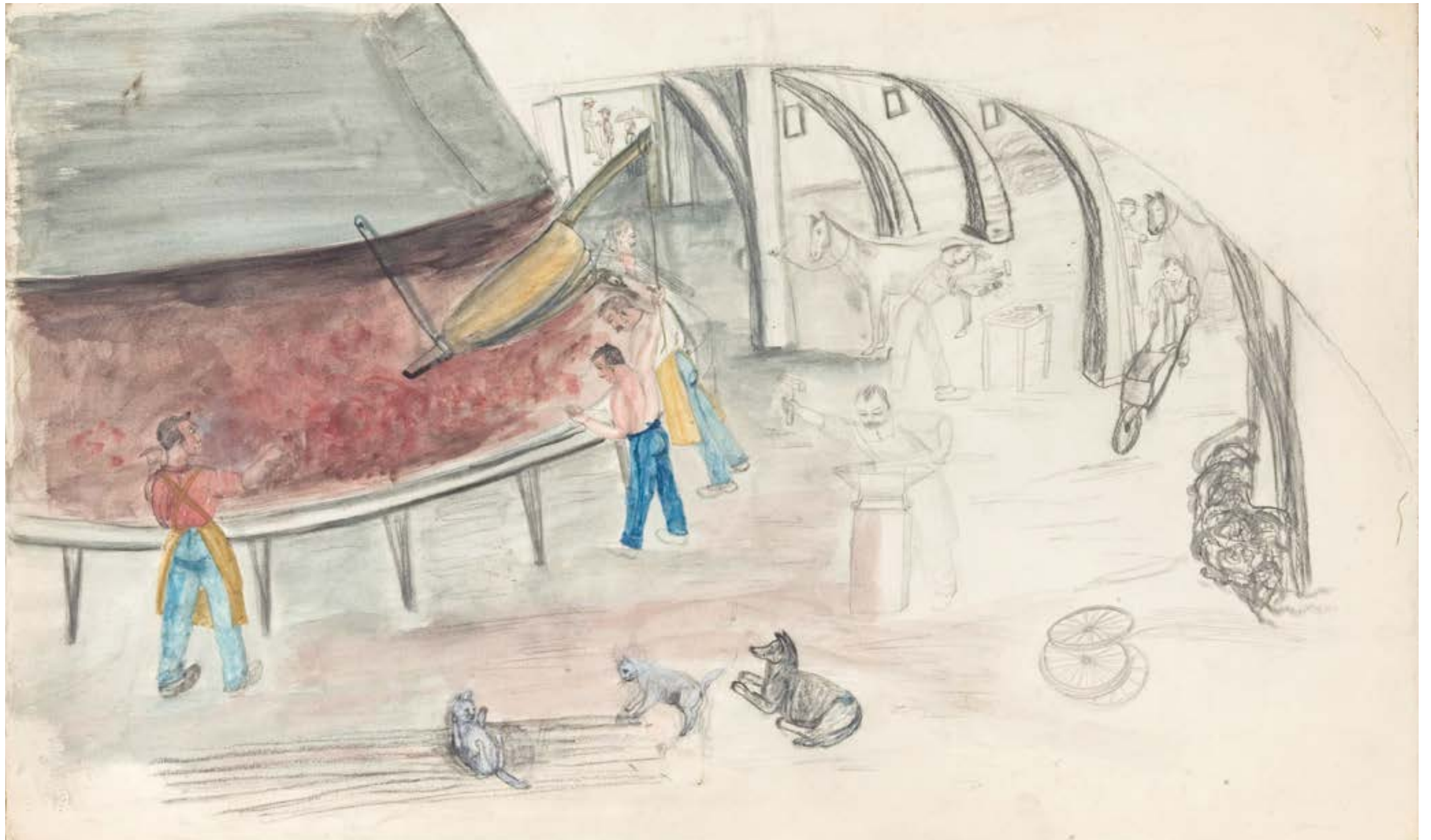
EXISTENCE, sans titre non daté, crayon, aquarelle COLL. PART.