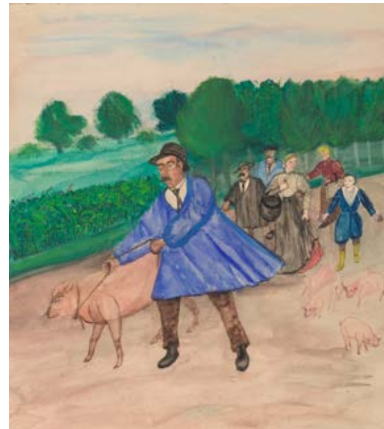
EXISTENCE, sans titre (fermier et ses cochons) non daté, encre, aquarelle, gouache COLL. PART.