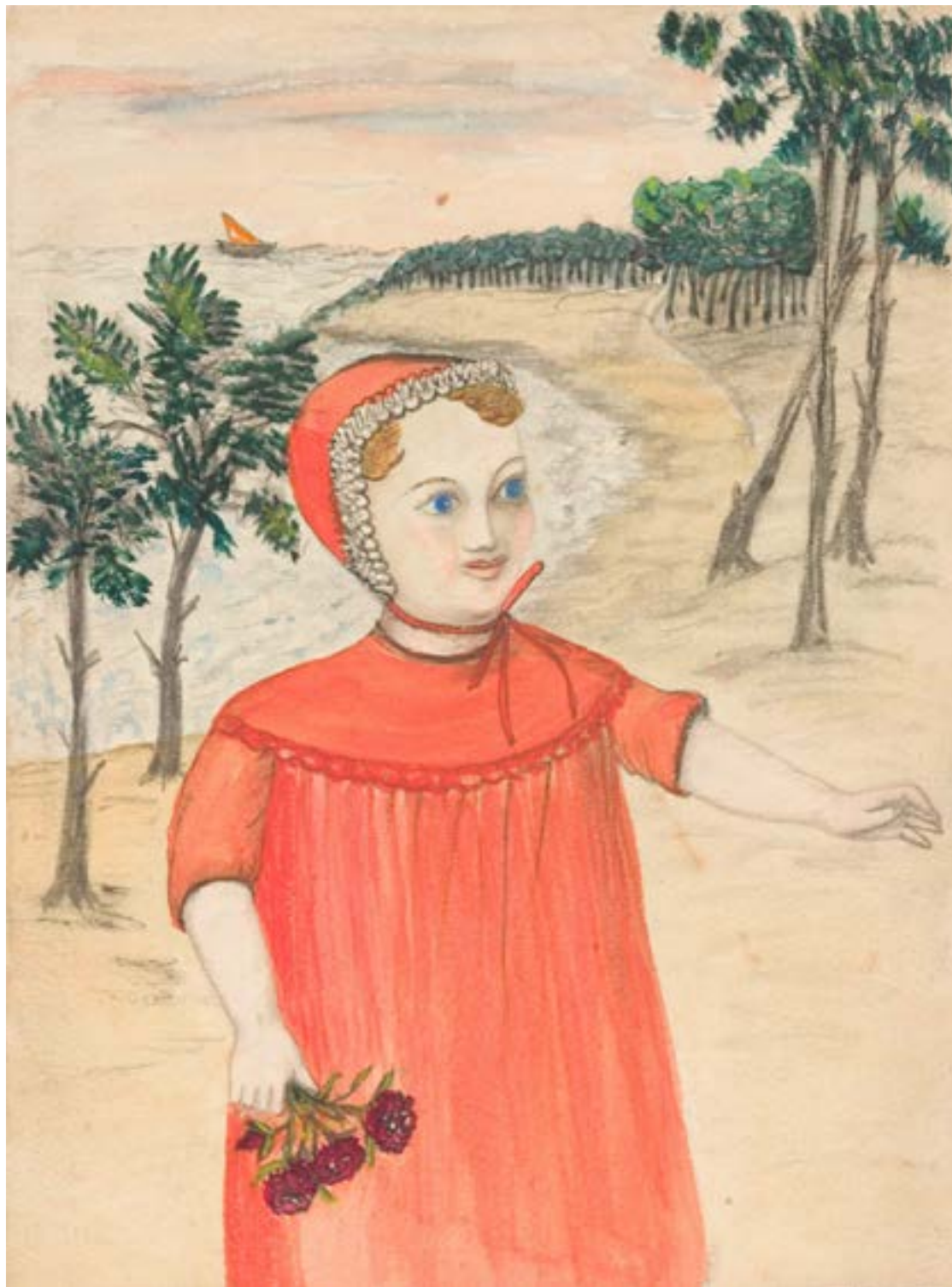
EXISTENCE, sans titre (enfant à la rose) non daté, crayon, aquarelle COLL. PART.