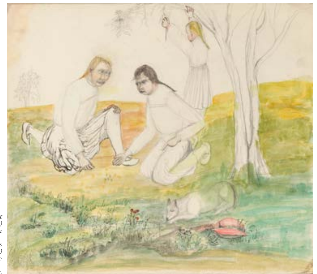
EXISTENCE sans titre (jeunes filles jouant aux osselets) non daté, crayon, aquarelle