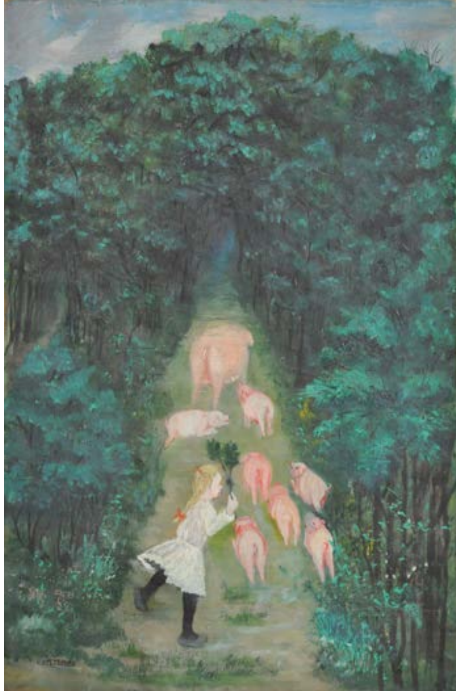
EXISTENCE, sans titre ( fillette menant ses cochons ) non daté, huile sur toile COLL. PART.